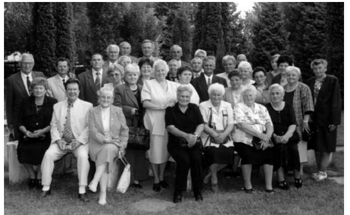
Az 50 éves találkozó résztvevői

mindig győzedelmeskedik a tapasztalat felett, hogy a nevetés az egyetlen gyógyír a bánatra. És hiszem, hogy a szeretet erősebb a halál-nál."