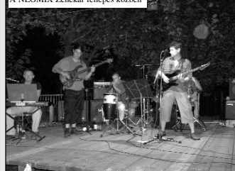
A NEOMIX Zenekar fellépés közben