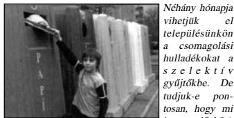
Néhány hónapja vihetjük el településünkön a csomagolási hulladékokat a szelektív gyűjtőkhöz. De tudjuk-e pontosan, hogy mi is a teendők? A

könyvezetvédelmi és Vízügyi Minisztérium nagy hangsúlyt fektet arra, hogy a gyerekek már most hozzászokjanak és természetesnek vegyék a szelektív hulladékgyűjtést, amit nekünk felhívóként megmutatunk. Három részes sorozatunkkal ehhez szeretnénk segítséget nyújtani. A papír, a műanyag, az üveg, az alumínium és az italoskarton-doboz felhasználásáról, gyűjtéséről és hasznosításáról szóló, az OKOPANNON kiadásában, az Országos Közoktatási Intézet támogatásával megjelent cikkeket adunk közre.