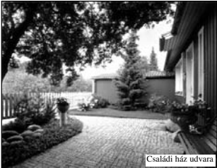
Családi ház udvara

Miután megérkeztünk, mindenki elment a saját vendéglátójával annak otthonába. Így együtt lakva a családokkal, az egy hét alatt mi is részesei lehettünk a finn mindennapoknak.