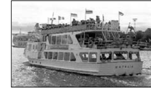
orgona, nárcisz és gyöngyvirág illatát.

Kipróbáltuk a finn szaunát, gyakran nagy derűtség közepette. Csodáltuk a rövid nyarat, (amely velünk együtt érkezett meg Finnországba), élveztük a most virágzó