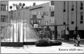
Kerava sétáló utca

A Solti Női Kórus kalandjai a fehér éjszakák országában