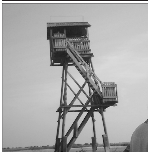
Ahonnán a szikes világot láttuk

A felső tagozat a nemzetközileg ismert Böddi-széken kirándult.